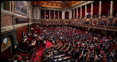
reuters.com French lawmakers make abortion a constitutional right

Danmark, tag ved lære og lad os følge trop! Det er tid til en liberal revolution! #dkpol