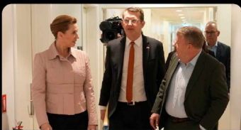
nyheder.tv2.dk Ny måling er historisk lavpunkt for Socialdemokratiet og Venstre

Niklas Stenbye @NiklasSt... · 29 feb. · Kære moderparti. Måske det er et vink med en vognstang?...Håber den her "MUS-samtale" fra vælgerne giver stof til eftertanke.. der skal seriøst gang i en stor omgang liberale småkager fra det her SVM bageri, hvis man skal "vide hvor man har Venstre" #dkpol