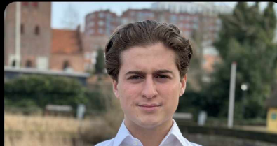
pio.io Venstres Ungdom: Afskaf værnepligten