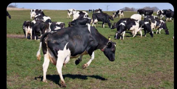
berlingske.dk En høj, ensartet drivhusafgift virker: Lad os ikke skrue ned for ambit...

Tobias Dahl @Dahl_Beck... · 04 mar. · Hold Ambitionerne høje, Lyt til Økonomerne, Smid ikke regningen på skatteborgeren